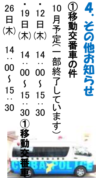
池周辺に停車しています