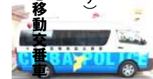
池周辺に停車しています