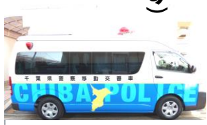
気軽に声をかけてください