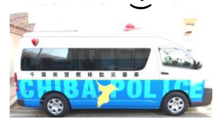
気軽に声をかけてください