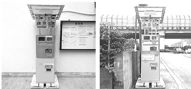
管理事務所入り口左 第2集会所斜め前