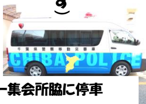
第一集会所脇に停車 しています